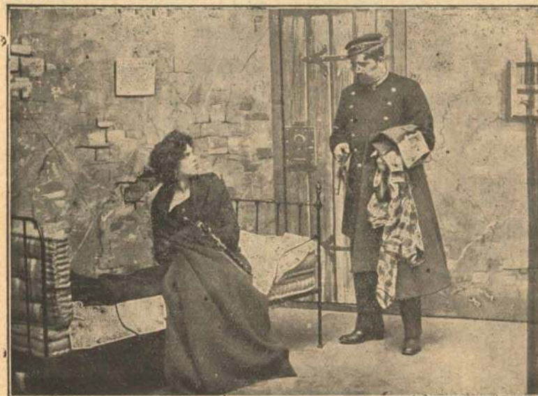
Forberedelser til Natteopholdet.