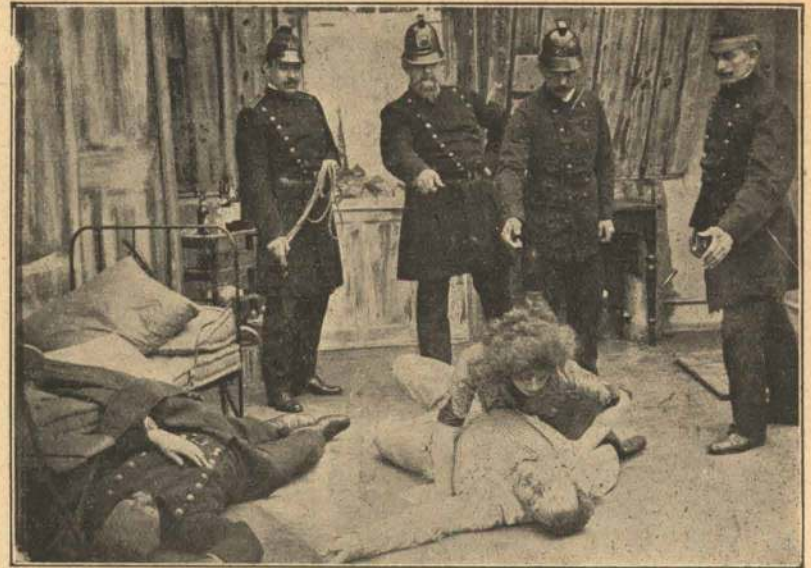
Den sidste Kamp.

Jens og Hansine flygter nu op i det gamle Kammer. »Aben« forfølger dem og træder ind. Hoverende fortæller han, at nu er Jens' Skæbne beseglet: Politiet er paa Trapperne. Da griber den rasende Jens »Aben« i Brystet og slynger ham ud af Vinduet.