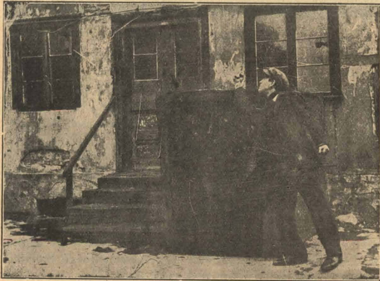
»Aben« opdager Forræderiet.

Politiet, og Idyllen hos Jens afbrydes brat ved en Betjents Ankomst. Da Betjenten vil lægge Haand paa Jens, kaster Hansine ham Peber i Øjnene. Jens snapper i Hast Betjentens Hjælm og Kappe, og medens den arme Betjent søger at gnide Peberet ud af Øjnene, forsvinder Jens og Hansine skyndsomst.