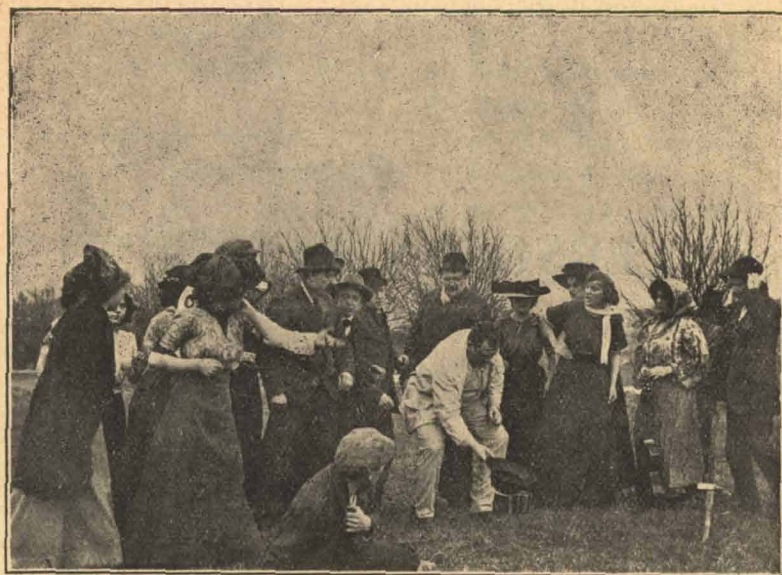
I Kongens Rige.

Soldaten en Seddel med følgende Paaskrift: »Overgiv Overbringeren heraf Kontorets Pengeskab til Reparation. — Knudsen, kgl. Smedemester.« Soldaten lukker dem ind, godtroende som han er.