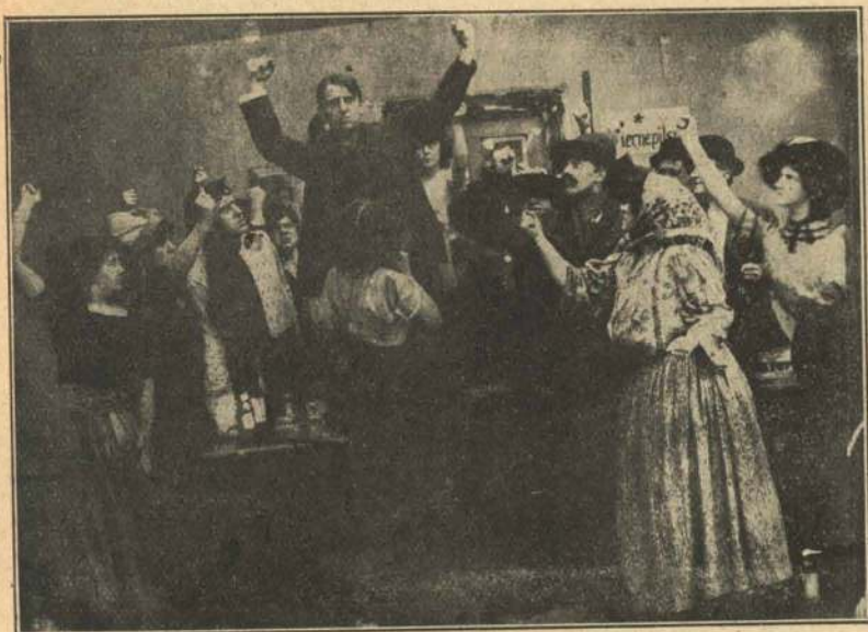
Den nye Anfører vælges.