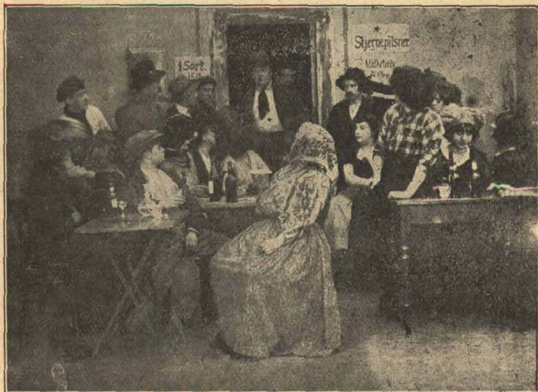
Kongen og hans Hof.

Pengeskabet transporteres nu af Jens, Rasmus og »Aben« ud til Bandens Depot, Lersøen, hvor det opbrydes. Her ser »Jens Krølle« sit Snit til, ubemærket at stikke Pengesedlerne, der findes i Skabet til sig, hvorefter han fortæller de to andre, at Kup'et er mislykket, Pengeskabet var tomt.