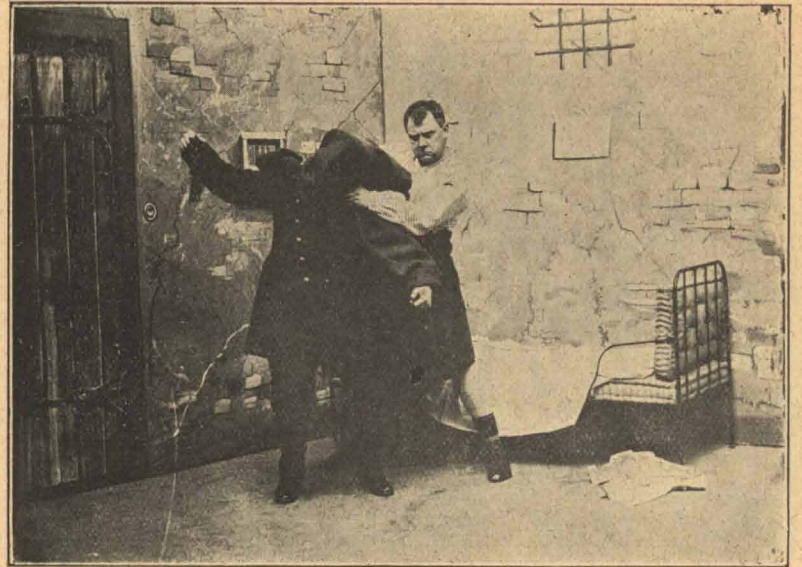
Rollerne byttes om.