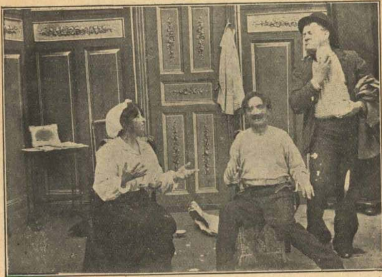
Kongen bliver soigneret.

ved gentagne Bankninger i Gulv og Loft, og paa denne Maade faar de i Forbrydersproget aftalt et Flugtforsøg.